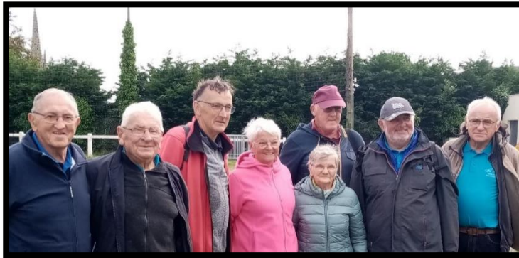
Les vainqueurs de la pétanque

La fin de l'été voit aussi la fin des interclubs. Le nôtre s'est déroulé le 18 juin. Il rassemblait 13 clubs des secteurs du Ponant et du Haut-Léon : Plouneventer, Saint-Derrien, Plougar, Bodilis, Plougourvest, Lampaul-Guimiliau, Guimiliau, St-Vougay, Plouzévédé, Plounevez-Lochrist, Tréfleze et Tréflaouénan avec 64 personnes aux dominos et 108 à la pétanque. Une vingtaine de bénévoles assurait le bon déroulement de la journée : suivi des inscriptions et des tableaux, intendance, service en salle et à la buvette ... Merci à tous pour la réussite de cette journée dont le bénéfice a permis de participer aux animations et sorties organisées.