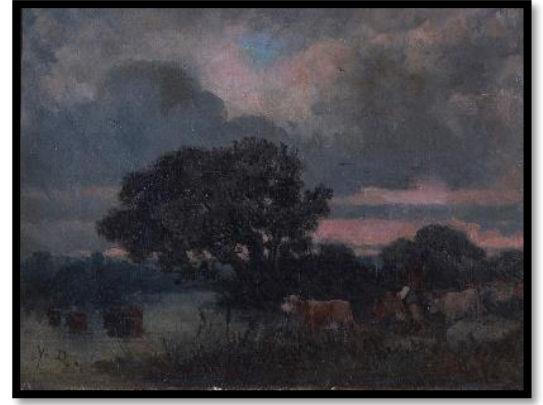
Vaches à l'étang