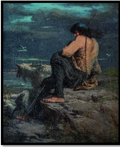
Pâtre sur les rochers de Plounéour