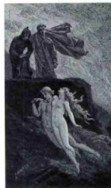
Paolo et Francesca - Gravure à partir d'un dessin de Yan' Dargent pour la Divine Comédie (Enfer, chant VI)