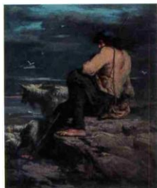
Père sur les rochers à Plouneour-Trez - Huile sur toile

On trouve dans l'église deux versions de La Mort de Salaün ar Fol : une huile sur toile immense, réalisée pour l'ossuaire de Saint-Servais, et une autre huile sur toile plus petite, présentée au Salon de 1895. Le dessin préparatoire de cette dernière est prêté cet été par les Amis du Folgoët.