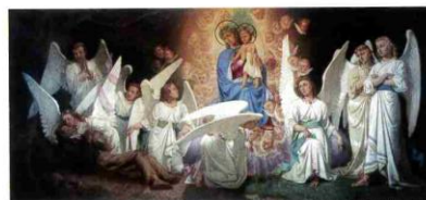
La Mort de Salaün ar Fol - Huile sur toile