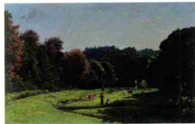
La queue de l'étang de Brézal - Huile sur toile

Installé dans l'ancienne école des garçons, le musée expose un large éventail d'œuvres peintes et une grande collection de dessins et livres illustrés de l'artiste. Il donne à connaître la vie de Yan' Dargent et présente toutes les facettes de son talent : paysagiste, portraitiste, peintre du légendaire, peintre du sacré, un des plus grands illustrateurs de son temps. La visite du musée se complète par celle de l'enclos paroissial où sont présentées des œuvres d'art sacré.