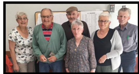
Les vainqueurs des dominos

Le travail terminé, les organisateurs se sont retrouvés pour faire le bilan de la journée autour d'un casse-croûte, moment très convivial. Le beau temps, la bonne ambiance et la présence de nombreux bénévoles ont contribué à la réussite de cette journée.