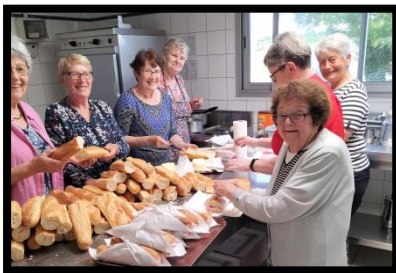
La préparation du goûter

80 joueurs de pétanque se sont retrouvés au terrain des sports autour des terrains bien délimités. Une seule équipe a gagné les 4 parties et 3 équipes étaient ex aequo avec 3 victoires.