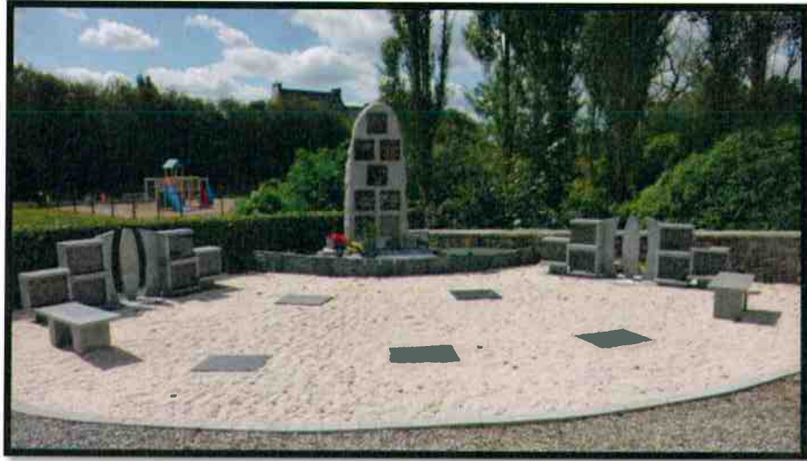
Le columbarium de 12 emplacements a été monté en début d'année.

Les travaux de restauration du tableau du musée Yan' DARGENT « Sainte Madeleine », le panneau et son trumeau (ci-joint) sont réalisés. Ils sont visibles à l'Ossuaire et au Musée.